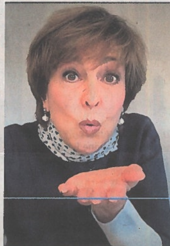
Show-Ikone Paola Felix schickte Cantz einen Abschiedskuss