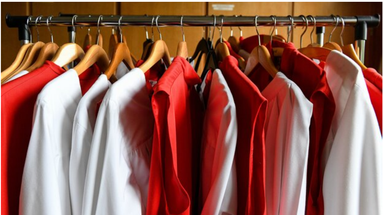
Messdiener Gewänder Kleiderstange Sakristei Ministranten

Die Arbeitsstelle für Jugendseelsorge der Deutschen Bischofskonferenz (afj) sieht durch die Corona-Pandemie derzeit keinen Rückgang der Messdienerzahlen. ”Ein Trend ist nicht erkennbar”, sagte der Referent für Ministrantenpastoral und liturgisch/kulturelle Bildung bei der afj, Tobias Knell, im Interview mit dem Portal katholisch.de. ”Natürlich besteht die Gefahr, dass wir Menschen verlieren. Aber der Ministrantendienst ist nach wie vor attraktiv.”