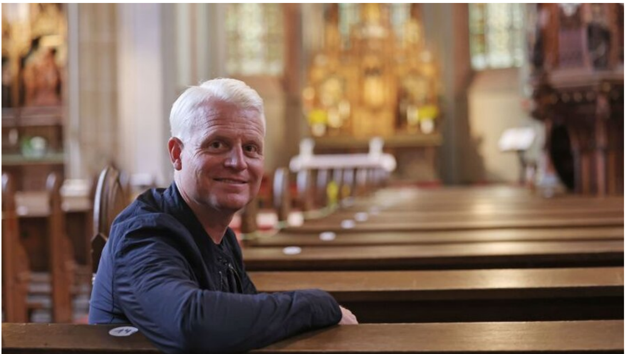
Guido Cantz in der Kirche seiner Heimatpfarre in Köln-Porz

Comedian Guido Cantz fühlt sich auch als Messdiener wohl. So habe er sich am vergangenen Pfingstfest in seiner Gemeinde in Köln-Porz spontan zum Dienst am Altar gemeldet, weil außer seinem Sohn kein anderer Messdiener anwesend war.